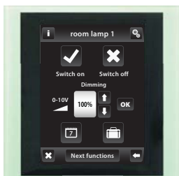
Glas / Grau