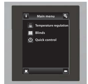
Chrom / Grau