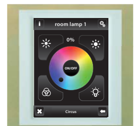
Titan / Eis