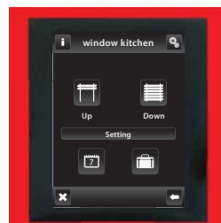
Rot / Aluminium