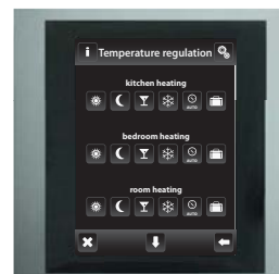
Aluminium / Dunkelgrau