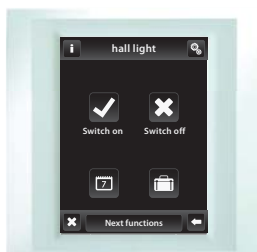
Weiss / Perlmutt