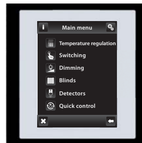
Schwarz / Weiss